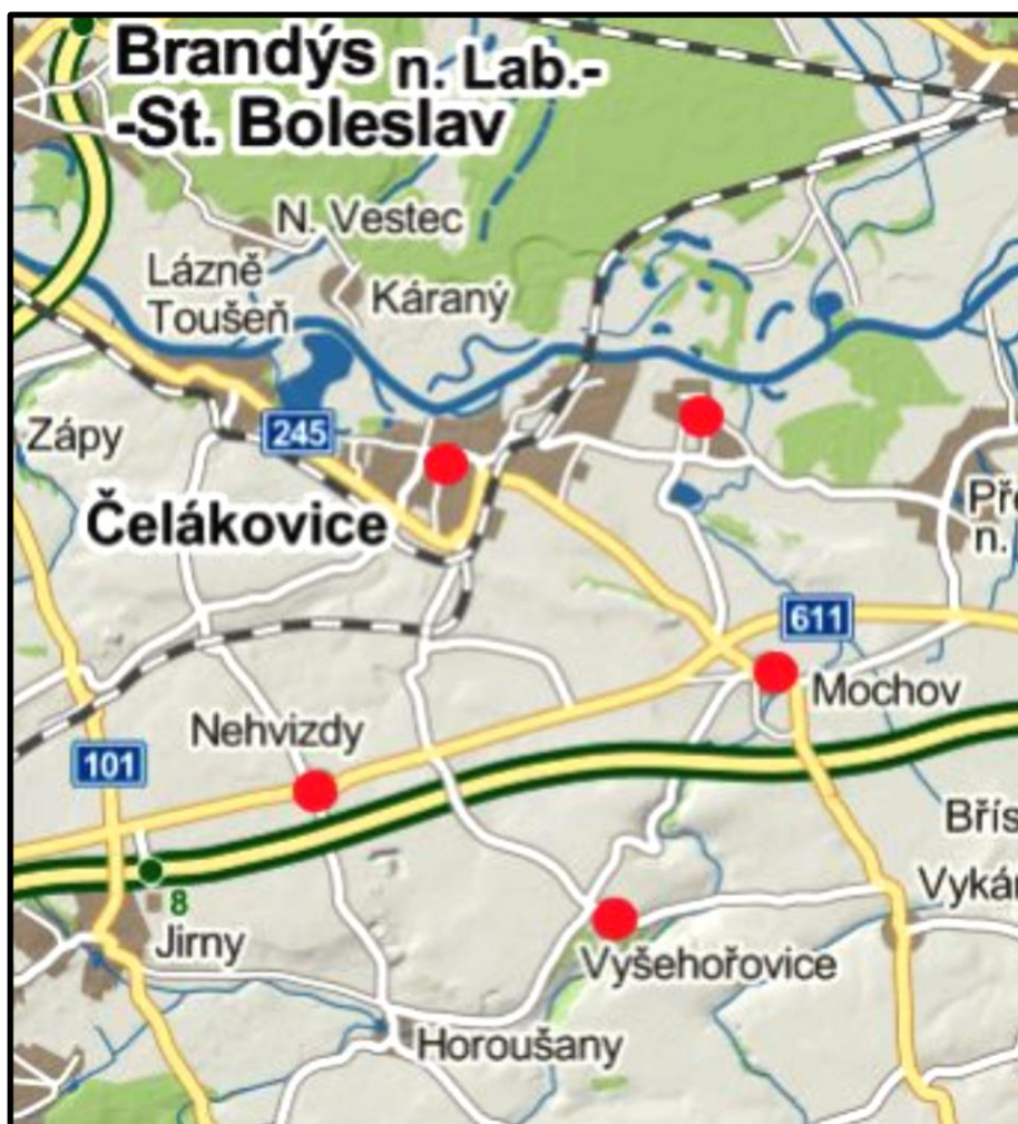
Obr. č. 2: Rozsah působnosti Pečovatelské služby Čelákovice, p. o. v roce 2017

V roce 2017 byla Pečovatelskou službou Čelákovice, příspěvkovou organizací, poskytována péče 234 klientům v celém širokém spektru nabízených služeb včetně fakultativních. Podstatnou část klientů tvořili občané města Čelákovice nebo jejich administrativních součástí (Sedlčánky). V okolních obcích pak byly služby poskytovány klientům na základě smluv, uzavřených s příslušnými samosprávami.